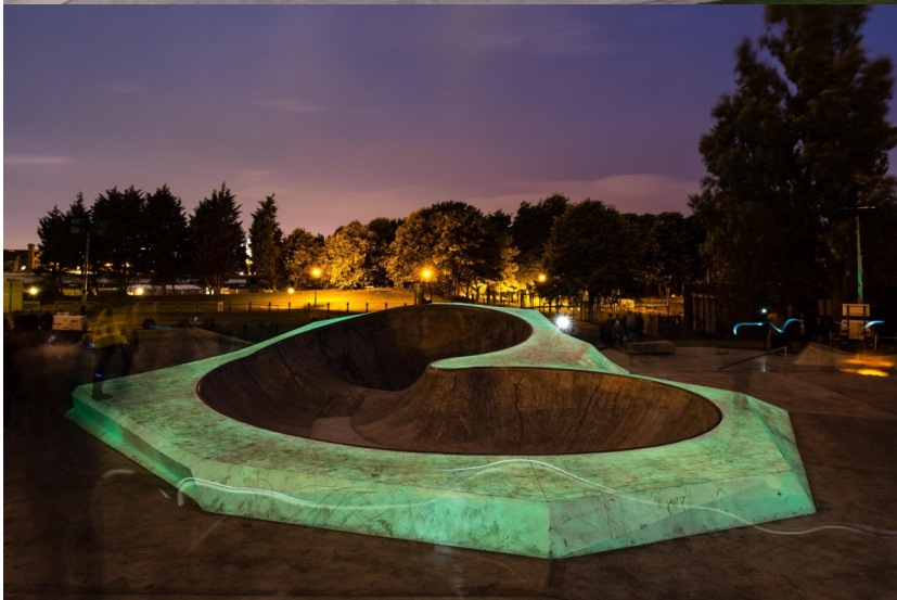
Koo Jeong-A – Evertro , 2015 – Liverpool